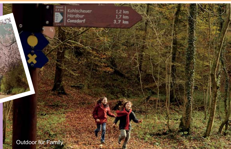
Outdoor für Family